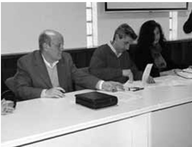
El proyecto es para "Mejora de Posicionamiento y Oferta en el Parque de la Prehistoria de Eduardo Castex".