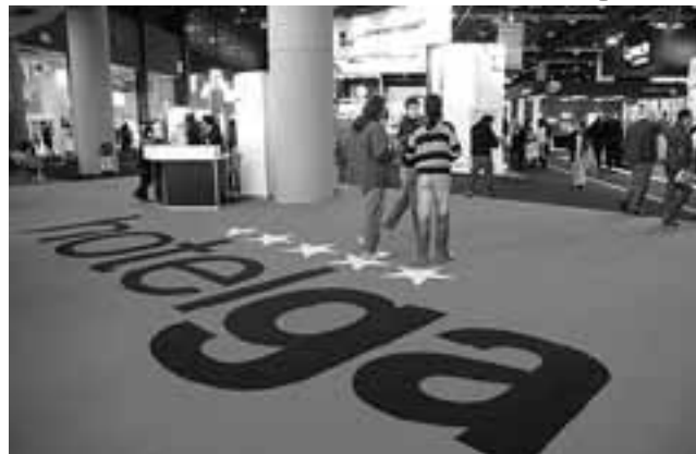
Del 29 de agosto al 1 de septiembre se llevará a cabo Hotelga 2011 en La Rural de Palermo. En un año particularmente activo en materia de inversión hotelera, se ha generado una gran expectativa por las innovaciones en equipamiento y tecnología que se presentarán.

Hotelga, consolidada como la segunda feria hotelera más importante de América Latina, contará con más de 250 expositores que se aprestan a demostrar la evolución constante de la industria y los servicios, permitiendo a los establecimientos hoteleros y gastronómicos, mejorar los estándares de servicios que demandan huéspedes cada vez más exigentes.