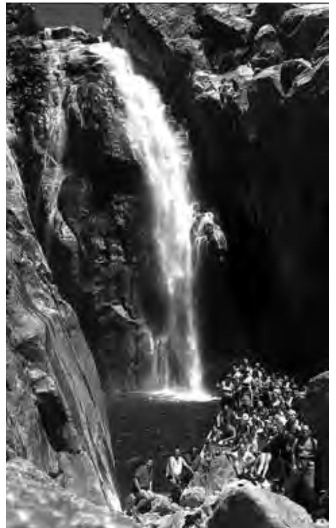
Integrantes del Club Inti Anti durante una excursión al cajón del río Hondo, posan para la foto en la base del Salto Escondido, en San Francisco, San Luis.