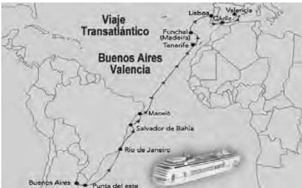
20 días de navegación anclando en Uruguay, Brasil, Islas Canarias, Isla de Madeiras, Portugal y España, luego en auto.

En este informe que constará de varias partes, como siempre haremos recomendaciones al lector para encontrar las variantes más económicas junto a alternativas probadas de buen resultado.