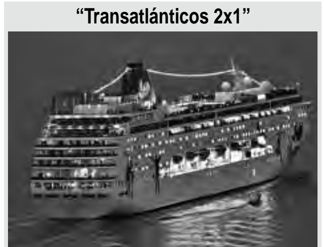
"Transatlánticos 2x1" 20 días de navegación con paradas en destinos espectaculares, 19 noches de alojamiento de lujo, 100 comidas a bordo y espectáculos diarios, pueden costar apenas un poco más que un viaje en avión.

La ilusión de realizar un viaje transatlántico en barco, como lo hicieron nuestros abuelos o bisabuelos, siempre resulta un sueño apasionante de todos, que sólo se ve amedrentado por la idea de un alto costo.