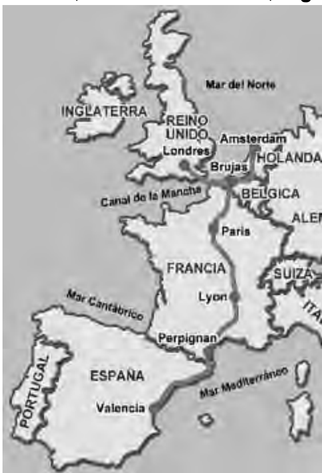
El recorrido propuesto en auto, no es un viaje caro teniendo en cuenta el destino. Para hacerlo bien y que resulte conveniente hay que programar con tiempo. Esto hará que consiga las mejores tarifas en transportes y hotelería. Tómese un año para hacerlo, Europa seguirá estando allí. Mientras tanto, disfrute de esta serie de notas que quizá le puedan ser de utilidad.

El alquiler de un auto es muy conveniente. Para un plazo mayor a una semana, calcular entre 20 y 30 euros diarios, con kilometraje sin límites, dependiendo del vehí-