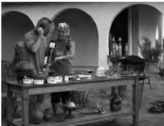
En la Estancia La Holanda de Carro Quemado, una de las propietarias, de la familia Ortiz Echagüe, realizó un plato a base de carne de jabalí en el disco.