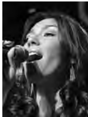
La cantante "Rocío" amenizará la noche de la entrega de premios.

tral hasta las 20 hs: Grupo de Arte Ecuestre junto al Ballet Tierra de Baguales. Grupo Musical. Ballet Folklórico. Juego de riendas $ 1.500 más lo recaudado