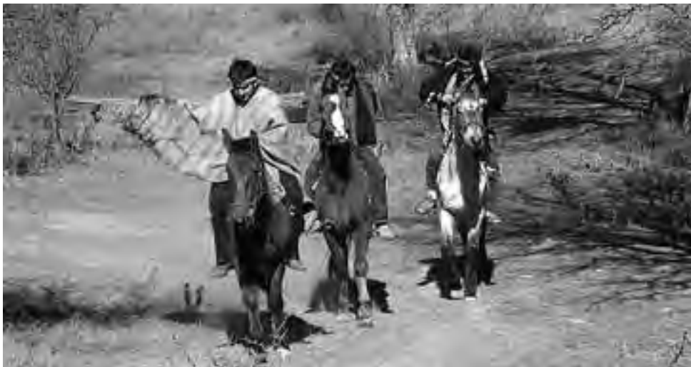
Qué más Pampa que los ranqueles para comenzar la fiesta. El pueblo originario que sus descendientes con orgullo han revalorizado, convocan a un Gran Encuentro con el acompañamiento del Gobierno Provincial en el finde largo de octubre.