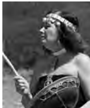
La primer actividad es el Gran Encuentro Ranquel en el CICOR.

El domingo 7 habrá una Charla sobre alternativas de Desarrollo con identidad en la Pampa, presentación de proyectos, Juegos Deportivos Ranküles, espectáculos y una charla debate sobre la "Relación entre el Pueblo Rankül y el Estado Argentino", convenio