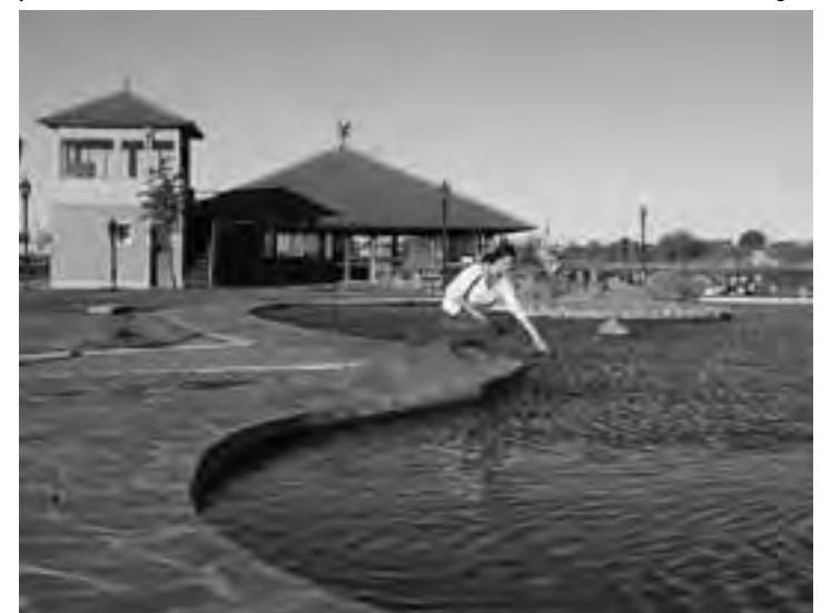
La celebración de la Semana del Turismo concluye este sábado 29 a las 18 horas en la "Isla de los Pájaros", en el predio municipal del Parque Don Tomás, con una degustación de productos regionales y espectáculos musicales y de danzas.