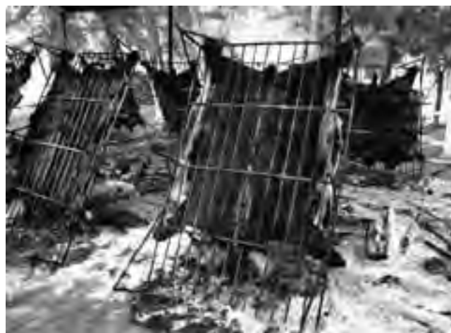
Las vaquillonas con cuero de Quemú Quemú. Famosas en toda la Argentina.

Este sábado 16 y el domingo 17, la localidad de Quemú Quemú se viste nuevamente de fiesta, para desarrollar uno de los eventos más importantes de La Pampa: el Encuentro Provincial y Nacional de Destrezas Gauchas, organizado por el Centro Gaucho Fortín Pampa.