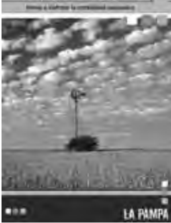
Promoción para Bahía Blanca, con la propuesta de "una escapada muy cerca".

ya que, concentra el potencial productivo de empresas locales y regionales. Su objetivo principal es vincular a los distintos actores de la producción, el trabajo, la industria, el comercio, los servicios y los centros de estudio, crean-