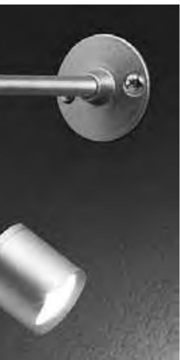
La naturaleza de la iluminación. La marca Ticar por donde combina distintos modelos de luminarias. La iluminación LED embellece los espacios de su hogar y que ahorran energía.

- Hoy en día ya se comercializan equipos de bajo consumo y con tecnologías "sustentables", así que estás pensando en comprar un aire, informe sobre cuál te conviene. En el caso en que ya tengas, es recomendable que mantengas cerradas las puertas y ventanas del ambiente que quieras