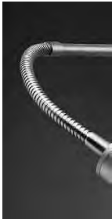
La iluminación LED está transformando la manera de iluminar. Por ejemplo, presenta su nueva línea Camera, donde la tecnología LED proporciona soluciones.

Iluminación: no es uno de los factores que más electricidad consume dentro del hogar, sin embargo, es uno de las variantes que más está desarrollada en el uso eficiente de energía. Acá te damos algunos consejos para potenciar el ahorro de luz: - El paso más simple que se puede hacer es apagar las luces que no utiliza-