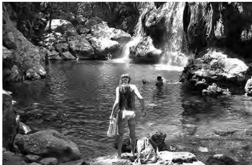
Manantiales de aguas termales que caen en cascada a una piscina natural de agua helada, la espectacular vegetación de la selva tropical y el sonido de la naturaleza son el principal atractivo de "Finca El Paraíso".