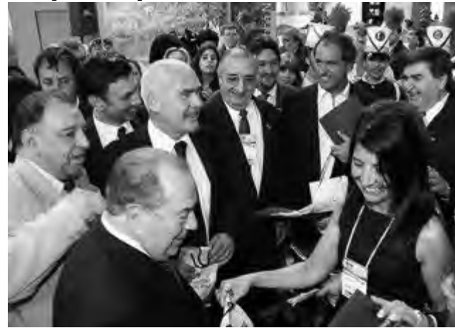
Nuevamente Turismo de La Pampa participará en el evento más importante del año a nivel nacional, la "Feria Internacional de Turismo (FIT) 2013", a desarrollarse del 14 al 17 de septiembre en el predio La Rural de Buenos Aires. Foto: edición FIT 2012 con la presencia del Gobernador Jorge.

Durante el evento, los principales operadores del turismo local e internacional se pondrán en contacto directo con todos los actores del sector para actualizar e impulsar sus ofertas turísticas. También, los profesionales vinculados al ámbito turístico podrán