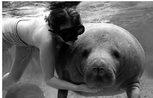
En el "Biotopo Chocón Machacas", el principal atractivo es la observación de los manatíes, pacíficos y gentiles animales que se pueden observar entre los nenúfares que pueblan las aguas del biotopo.

Ideal para un fantástico paseo en el que el paisaje ofrece miles de ángulos y oportunidades para los amantes de la fotografía.