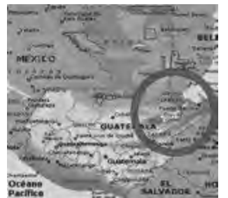
Izquierda: ubicación del país, Guatemala, situado en América Central, bañado por el mar Caribe.