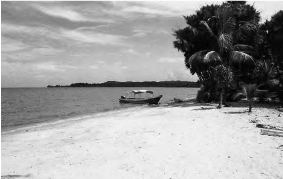
Rodeado por una exuberante vegetación y bañado por las cristalinas aguas del mar Caribe, el departamento de Izabal en Guatemala, ofrece parajes mágicos en los que usted puede descansar y disfrutar de unas vacaciones tranquilas o vivir aventuras llenas de actividad.

Siete maravillosas piscinas naturales en las que se puede disfrutar las frescas aguas del río. Saliendo desde Livingston y luego de atravesar la bahía de Amatique se llega a un pequeño muelle en el que queda la embarcación. Desde ahí, una caminata de aproximada-