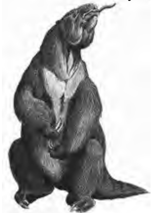
(Dibujo recreativo de un Megaterio)