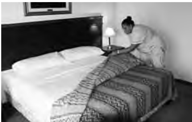
Se anunció para este año, la participación de La Pampa en el "Torneo Nacional de Mucomas" que organiza FEHGRA.