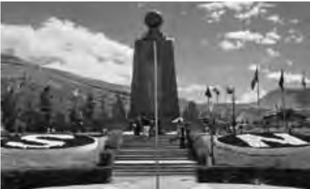
Monumento a la línea ecuatorial en Quito: una torre truncada, en cuyo interior se alojan un museo etnográfico que ilustra los grupos indígenas en el país, coronado por la reproducción del globo terrestre.