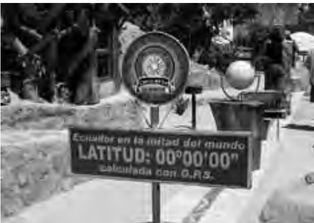
El Museo Solar Inti Nan tiene guías dispuestos, que conducen a experimentos fascinantes que demuestran la impresionante diferencia en la atracción de la Tierra sobre ambos lados de la línea ecuatorial.