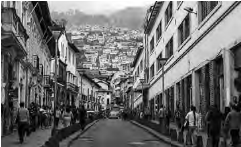
Una imagen del sector colonial de Quito, la ciudad capital de la República del Ecuador.

El lugar, muy visitado por los turistas nacionales y extranjeros, conserva un cierto encanto, aunque transformado en una especie de parque de atracciones, con restaurantes y tiendas de recuerdos. Una avenida bordeada de piedras con los bustos de eminentes científicos, terminando con el mo-