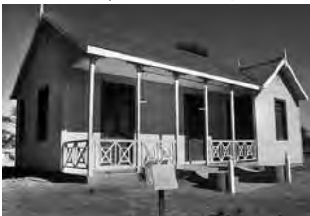
El viernes 2 de mayo (feriado puente turístico) a las 15:30 hs. habrá una excursión vehicular al Museo El Caserío y el Matusalén.