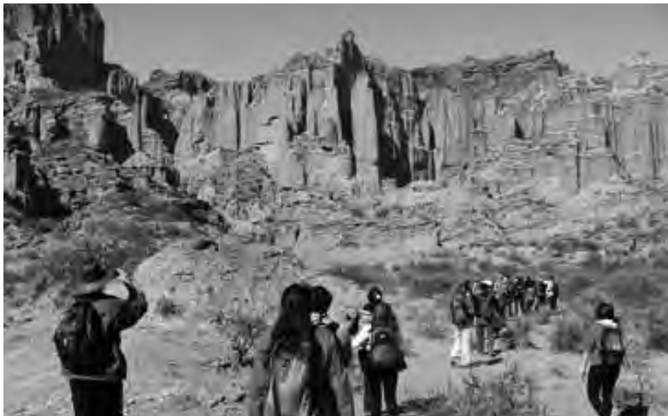
Parque Nacional Sierra de las Quijadas, a menos de 120 km de San Luis capital.

¿Qué tal si agarramos el auto y hacemos un raid por las provincias limítrofes de Mendoza y San Luis? Ya sé que estamos sobre la hora para esta partida, pero el viajero experimentado siempre tiene su mochilita preparada y sabe improvisar. Y si no se puede, le queda el otro finde largo del 20 al 22 de junio