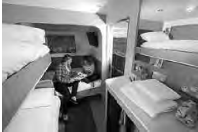
En un espacio reducido, todo el confort. La pérdida de mayor amplitud, se gana con la posibilidad de alojarse "al lado" de donde se desarrolla la actividad.

con 2.000 habitaciones ubicadas a pocos minutos de varios estadios. Estas instalaciones se conocen ya como la Villa de Fútbol y tendrán acceso a servicios como centros de compras, lugares para comer y suficientes televisores para ver los partidos. Recientemente Snoozebox ofreció hospedaje durante los Juegos de la Commonwealth en Escocia y en los Juegos Olímpicos de Londres en 2012.