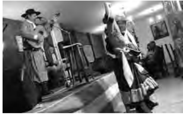
El funcionario nacional destacó que el porcentaje de argentinos que viaja, a nivel nacional, es del 43%, “lo que constituye una proporción muy alta comparada con otros países”, diferenciándose el caso de los patagónicos que lo hacen en un 53%.

Por otra parte, en cuanto a la contratación de paquetes turísticos, Suárez reveló que la mayoría de los argentinos organizan sus viajes por cuenta propia. “Eso no quiere decir que no consuman servicios receptivos ni que cuando llega a cada una de las localidades no vaya al operador; quiere decir que cuando está en su casa al momento de organizar su viaje, entra a internet, compra los servicios de alojamiento o reservas, compra sus transportes o alquila su auto. Esa modalidad se da en el 95% de los casos”, indicó. “Entonces -agregó- nosotros a los agentes de viajes les decimos que hay que reinventarse, a pesar que la gente no sabe que la mayoría de las compras por internet lo hace a agentes de viajes, pero no