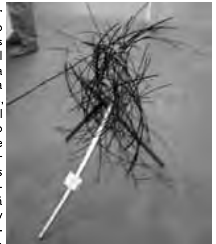
"Fuego" de Nahuel Pumilla, obra ganadora del 2do Concurso La Pampa Arte & Hierro 2012.

Para mayor información comunicarse a los tel: (02954) 453443, 454443 ó 454433.