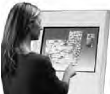
El moderno equipamiento servirá para brindar más y mejor información a los turistas que transitan por el Corredor Central.

Estas acciones de planificación y gestión de las potencialidades turísticas del territorio constituyen un requerimiento esencial para el desarrollo de la actividad turística, puesto que garantizan la correcta integración del turismo a la economía, la sociedad y la cultura, así como la adecuada satisfacción de la demanda turística.