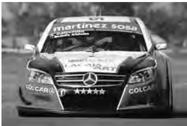
El Mercedes Benz de Agustín Canapino, puntero del campeonato en el TRV6