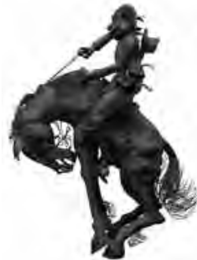
Obra del artista Fabian Villani