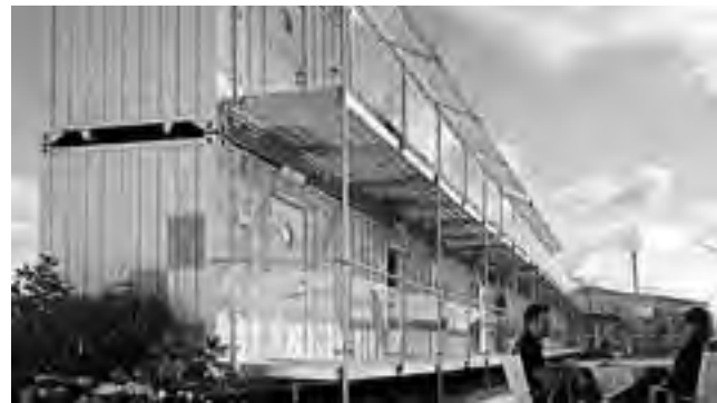
Villas completas con todos los servicios son instaladas en 48 horas. El servicio será contratado para el Mundial de Rusia en el 2018.

Comodidades Cada habitación cuenta con pequeños sanitarios con ducha, lavabo e inodoro. Como en los