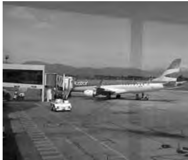
El turismo interno representa el 80% de la balanza turística nacional, lo que se traduce en 63 millones de arribos en todo el país.

“Después tenemos diversificado, tenemos internacional, de grandes distancias, de Buenos Aires, Rosario o Córdoba -los grandes centros emisores-, pero el principal mercado está al lado, entonces la estrategia comunicacional no tiene que abandonar a su propio mercado”, dijo.