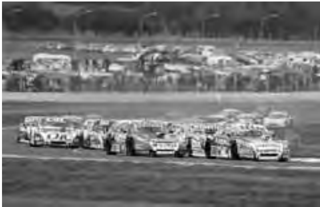
VIENE DE TAPA