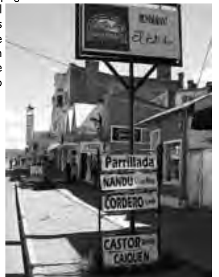
«Todo bicho que camina va a parar al asador»...