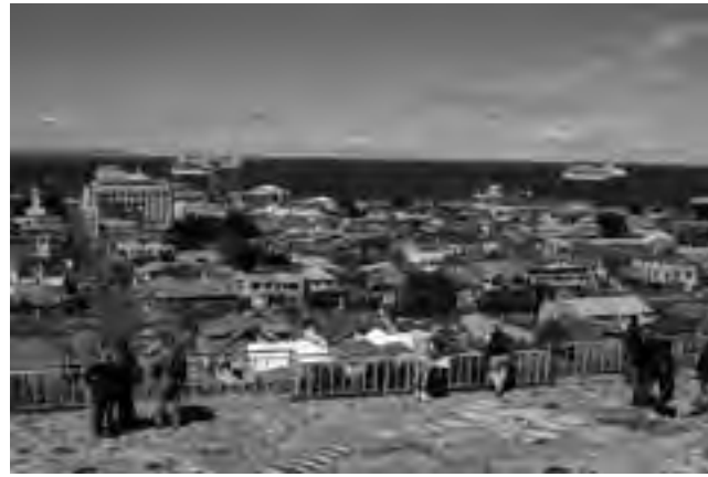
Colorida vista de Punta Arenas desde el Cerro De La Cruz. La ciudad es sede permanente de llegada de las grandes compañías de cruceros.

La plaza Muñoz Gamero con su escultura en memoria del descubrimiento del Estrecho de Magallanes, es cita obligada para adquirir artesanías regionales y la Zona Franca además, hace que los visitantes pueden adquirir productos de todas partes del mundo favorecidos por la nulidad de gravámenes impositivos.