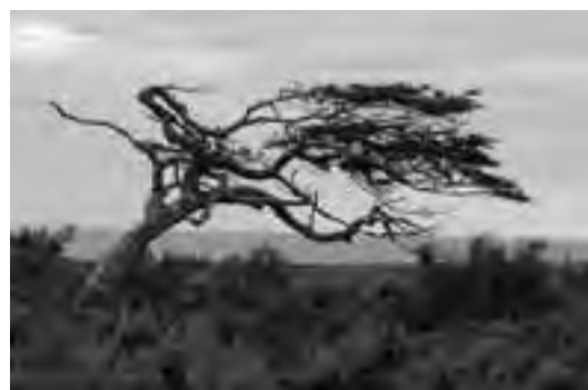
Para aprender de vientos hay que ir a esta zona en invierno. La foto del árbol está sacada «cuando no hay viento»...