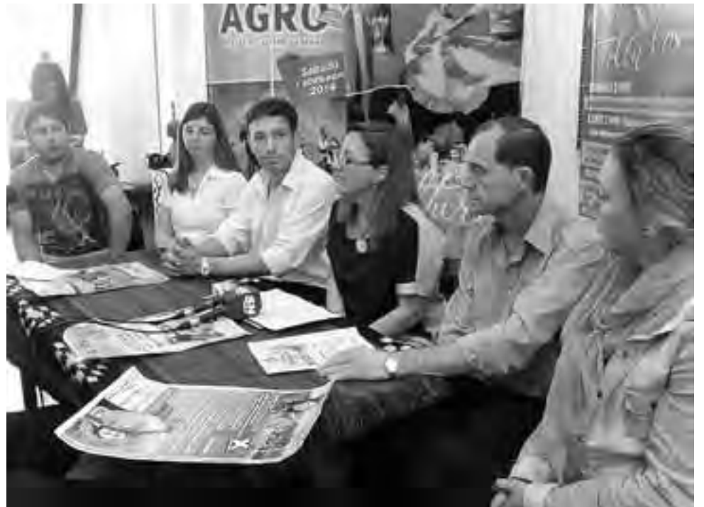
Presentación de las Fiestas Populares en la sede de "Arte Propio".

Esta fiesta tiene una trayectoria de 10 años y el año pasado fue declarada Fiesta Provincial, incluye desde el 2 al 8 de noviembre una intensa actividad de espectáculos artísticos, danzas y jineteadas. El acto central será el sábado 8 a las 17:30 hs. con el desfile cívico militar y en el final de la jornada se realizará la elección de la Reina de las Estancias. Los festejos se enmarcan en