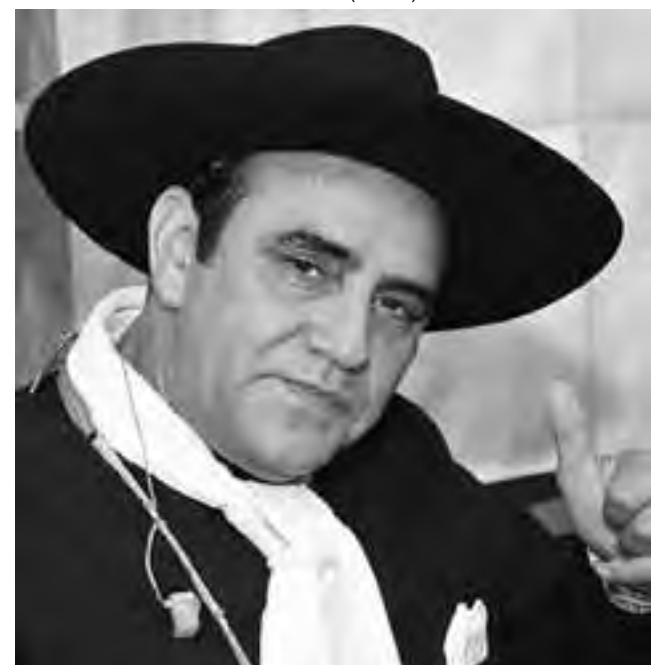
El Chaqueño Palavecino actuará en Conhelo el sábado 8 de noviembre.

Se llevará cabo en el Salón de Usos Múltiples de la localidad. Habrá comidas típicas criollas como empanadas y choripanes, elaborados por la gente de la comunidad. Se espera la presencia de numeroso público de localidades de la zona y de provincias vecinas. Para mayor información sobre la inscripción de los artistas se pueden comunicar de 7 a 13 hs. de lunes a viernes al teléfono (02334) 482001