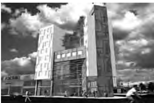
Maqueta digital del proyecto en las avenidas Argentino Valle y Luro.

Hace más de un mes, el concejo deliberante de Santa Rosa aprobó la construcción de un apart hotel del Centro Empleados de Comercio (CEC), que se levantará en la esquina de las avenidas Luro y Argentino Valle, de Santa Rosa.