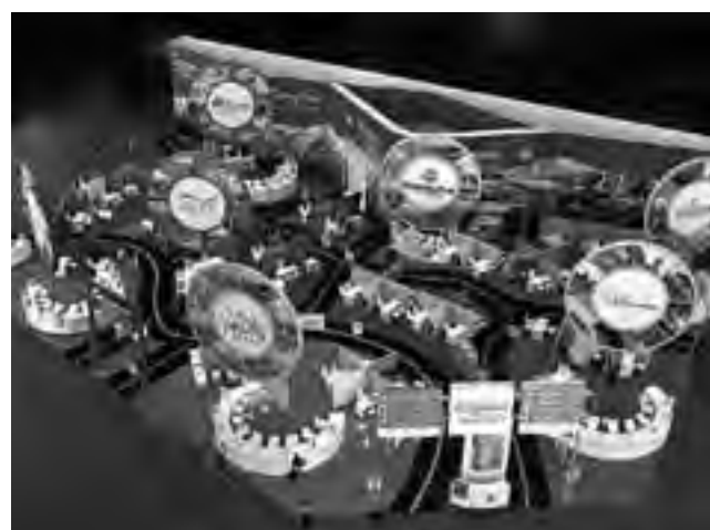
Maqueta de la isla que ocupará la Región Patagonia en la FIT 2014. Dentro de la misma, tiene su stand la Secretaría de Turismo de La Pampa.

Este año, como en ocasiones anteriores, la provincia de La Pampa estará presente con su Stand Turístico, dentro de la isla promocional de la Región Patagonia, que en esta edición de la FIT propone toda una experiencia de viaje con lenguaje de ruta, que invita a seguir un circuito patagónico por los clásicos caminos del sur argentino. La Feria Internacional de Turismo (FIT), que se desarrollará en La Rural de Buenos Aires desde este sábado 25 hasta el martes 28. El stand con lenguaje de ruta invita a seguir un circuito patagónico por los clásicos caminos del sur argentino. Pero allí no se acaba la propuesta. Porque bien sabido es que hoy no basta con transitar el viaje, además hay que compartirlo. Y también eso será posible en el espacio de Patagonia en la FIT, ya que los visitantes podrán tomarse fotografías en los imponentes paisajes patagónicos y subirlas a sus perfiles en las redes sociales, para que sus contactos aprecien