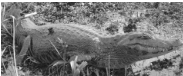
Por medio de lancha se llega a la zona del yacaré negro y el overo.