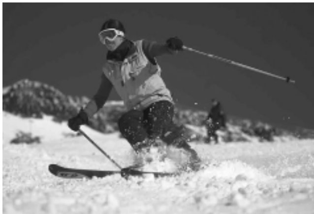
La incorporación de los nuevos equipos pisapistas le permitirá a Cerro Chapelco reacondicionar todos los días más eficientemente las 24 pistas del complejo que tienen 140 hectáreas esquiabiles

A la fecha las tarifas vigentes de los pases para la próxima temporada se ubican en un 10% por encima de las de la temporada