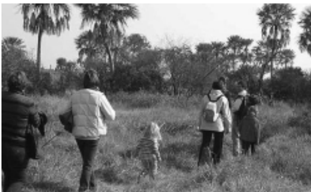
«Iberá Expediciones» ofrece múltiples salidas, a elección del turista.

En cuanto a los paquetes completos, existen opciones que van desde $ 230 hasta $ 510 por persona. Más información en: www.iberaexpediciones.com reservas@iberaexpediciones.com (03773) 15443602 / 15401405