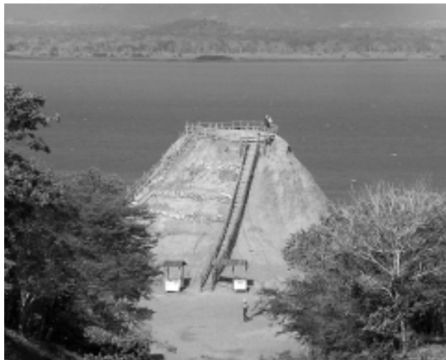
A 60 km de Cartagena, camino a Barranquilla, está el Volcán del Totumo. Los turistas van bañarse en su interior con lodo, de propiedades curativas. El acceso es a través de una escalinata hasta la boca del volcán.

Esta es la tercera y última nota sobre Colombia, teniendo como base de movimiento la ciudad de Cartagena de Indias, de la cual hablamos en las anteriores dos ediciones. En REGION ® N° 904 sobre su historia, la zona moderna de Bocagrande y la exquisita Ciudad Antigua. En REGION ® N°