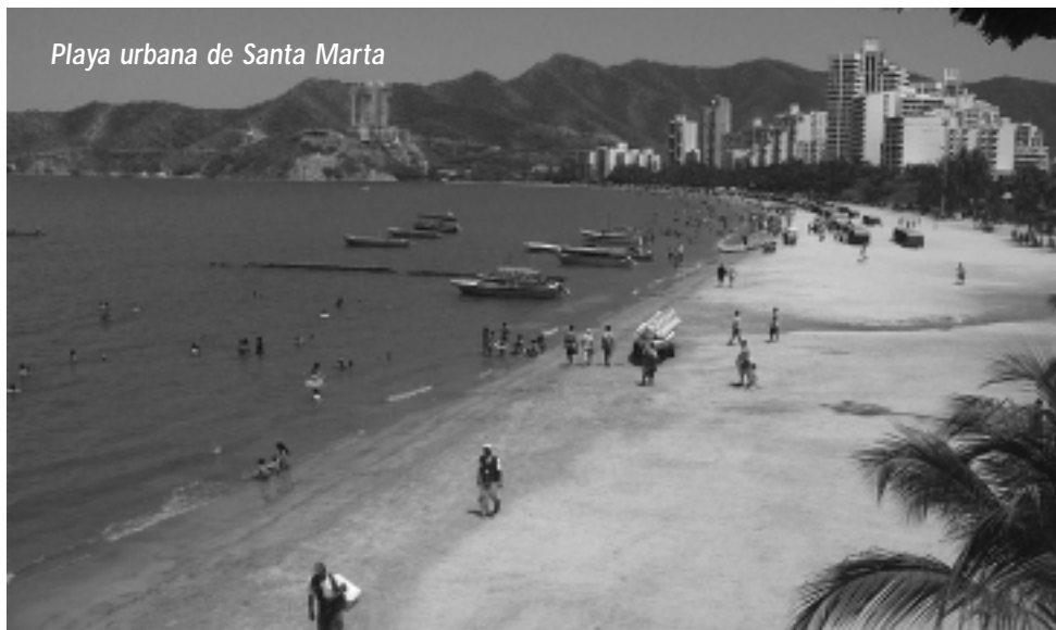
Playa urbana de Santa Marta

Barranquilla, destacado evento cultural. Tiene sitios turísticos muy hermosos como Bocas de Cenizas (donde se une el Río Magdalena y el Mar Caribe) y ricos antecedentes como el primer zoológico que se inauguró en América latina, el estadio metropolitano (el más grande de Colombia), el Puente Pumarejo (el más largo del país), el muelle de puerto Colombia y el Museo Romántico, por nombrar algunos.