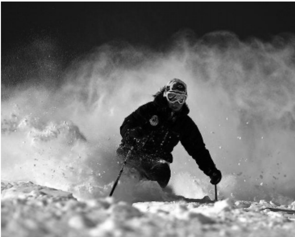
Ciento cincuenta mil euros se invirtieron en un sistema de innivación inducida (creación de nieve artificial), con nuevos medios de elevación y el mejoramiento edilicio y de pistas, aptas para todos los niveles de la familia. El Cerro Chapelco vuelve a ser sede de la Copa del Mundo de Snowboardcross y ahora del Snow Polo del World Polo Tour.