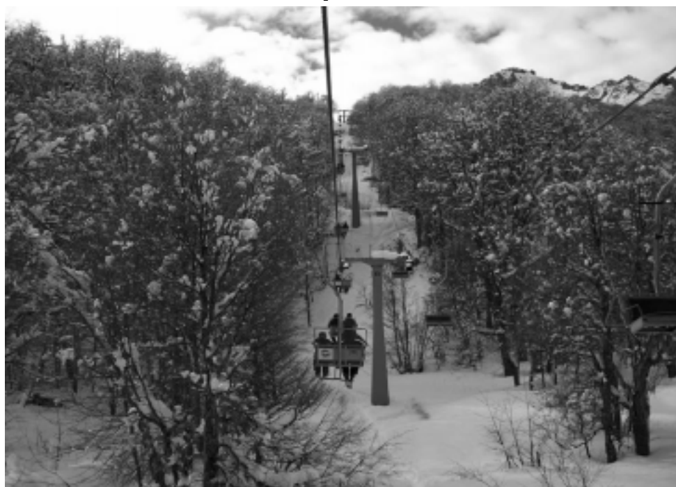
El Cerro Chapelco, de 1980 metros de altura, forma parte de una paradisíaca cadena montañosa de la Cordillera de los Andes, con imponentes vistas del lago Lácar y del volcán Lanín.

La incorporación de los nuevos equipos pisapistas le permitirá a Cerro Chapelco reacondicionar todos los días más eficientemente las 24 pistas del complejo que tienen 140 hectáreas esquiabiles con pendientes que varían entre 20° y 45° y un importante desnivel de 730 metros, y una longitud máxima de 5,3 kilómetros. Esta incorporación implica un significativo incremento de la confortabilidad y la seguridad para la práctica del esquí en todas las pistas, que presentan una amplia gama de dificultades para visitantes de todos los niveles de esquí y snowboard.