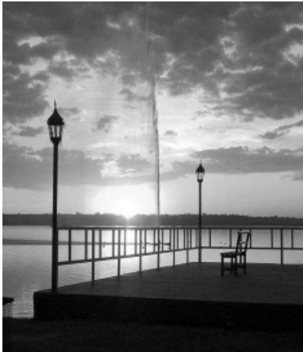
El congreso no tiene costo de inscripción. Se desarrollará en las instalaciones del comedor del Centro Recreativo Don Tomás. Habrá 50 lugares de alojamiento gratuito en el albergue de la Municipalidad de Santa Rosa.

VIENE DE TAPA El congreso significará un intercambio de experiencias y de difusión de las actividades vecinales de nuestro país. Se hará en el marco del programa de fortalecimiento institucional y de formación y difusión para dirigentes vecinales, que se desarrolla de acuerdo al convenio de cooperación entre COVERA y el Ministerio de Desarrollo Social de la Nación.