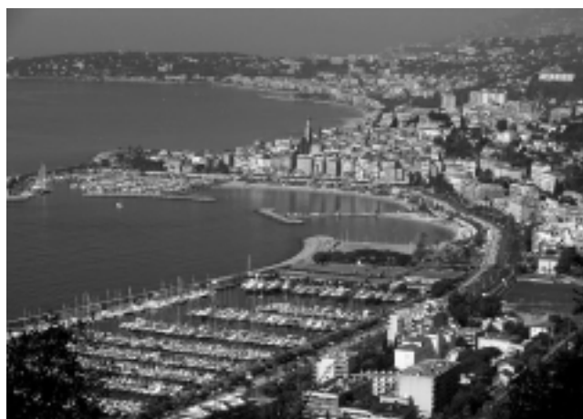
Imagen de La Costa Azul, también llamada la Riviera Francesa.

Ya estamos en la 5ta Parte de la nota, cuya propuesta de viaje es recorrer una porción de Europa en auto, a partir del ingreso por Madrid, con una ruta bordeando el Mar Mediterráneo -sur de España y de Francia-, hasta atravesar Italia por el norte, llegando al Mar Adriático, en Venecia, con regreso al punto de partida.