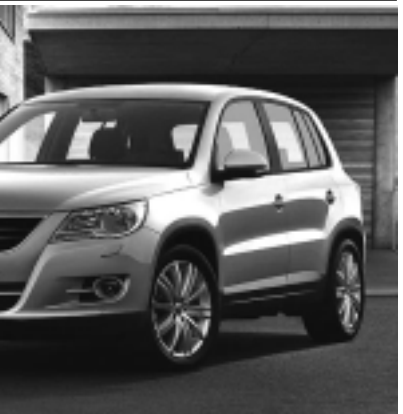
en la plataforma del monovolumen Touran, es un 5 puertas y cinco plazas, que mide 4,40 de largo; 1,80 de ancho y 1,68 de alto.

(*)Relato bíblico: Libro de Génesis, capítulos 41 y 42.