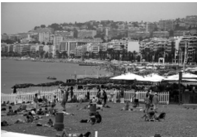
Encajonada entre el luminoso cobalto del Mediterráneo y los Alpes Marítimos, Niza es la niña mimada de la Riviera francesa, una dama elegante, amante del arte y del buen vivir que merece la pena cortejar sin prisas.

Si de fauna marina se trata, no deje de visitar «Marineland», un complejo ubicado en Antibes, en-