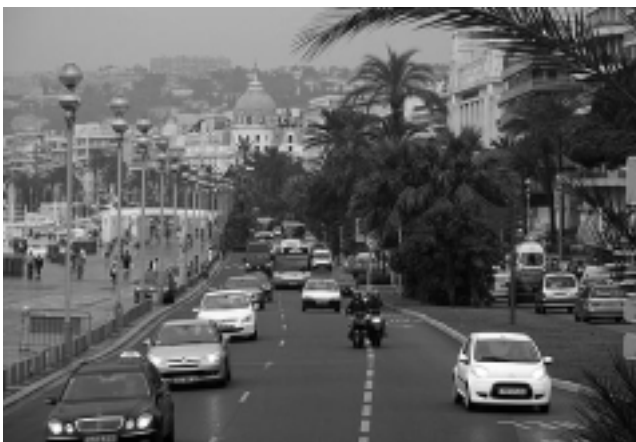
«Promenade des Anglais», adornada por una extensa hilera de palmeras y miles de coloridas flores, conforma un paseo marítimo excepcional que es cita obligada a la hora de recorrer la Costa Azul.

En el próximo número: De la Costa Azul a Aragón