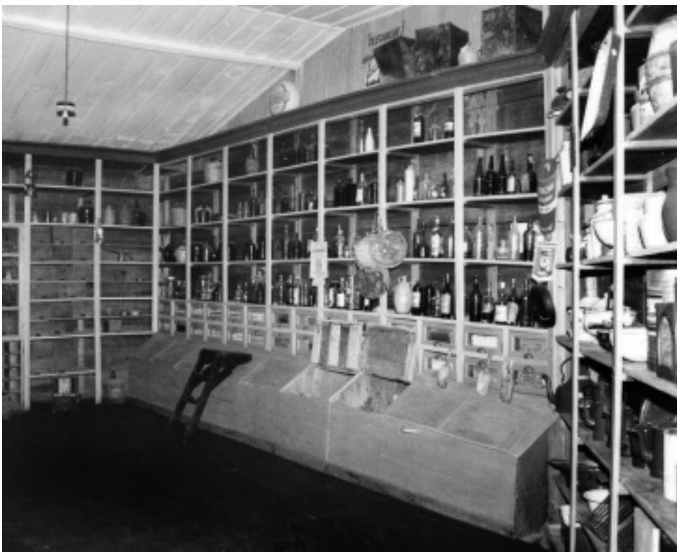
Los visitantes se sorprendieron gratamente al observar el edificio y su entorno en excelente estado de conservación y mantenimiento, lo que evidencia el gran trabajo que se está realizando desde la Comuna. Entre los temas desarrollados, se evaluó la posibilidad de realizar actividades culturales y artísticas en los espacios libres que dispone