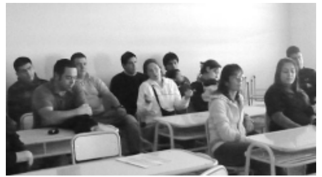
A pedido del Delegado Comunal de Casa de Piedra, personal del Área Técnica de la Subsecretaría de Turismo dictó una capacitación sobre ¿Qué es el Turismo? y Turismo Sustentable, destinada a los pobladores locales de la Villa.