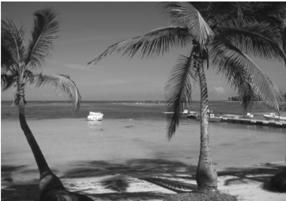
Si hay una postal clásica del Caribe es Punta Cana, 420.000 m2 de belleza donde lo que se destaca son sus 50 kilómetros de playas, de arenas blancas, finas y mar turquesa. Importantes excursiones están vinculadas.

La historia de Punta Cana comienza hace pocos años, en 1969 donde inversionistas llegaron a la zona y adquirieron un territorio que no superaba los 50 kilómetros cuadrados, donde no había otra cosa que playas y tumultosa