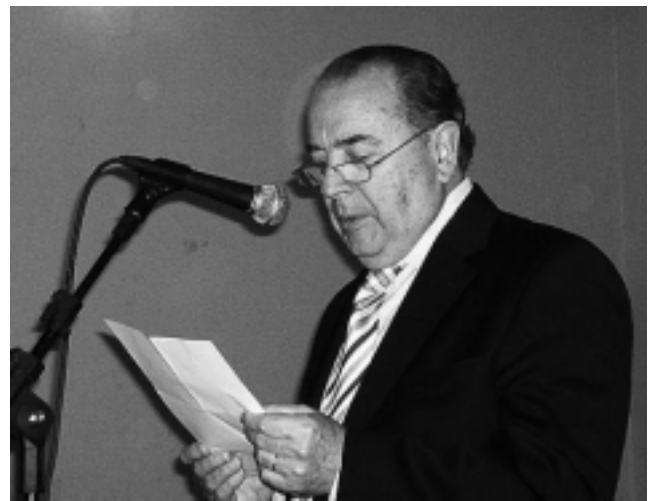
Para «atemperar la crisis», Jorge mencionó que hay $ 1.000 millones en obra pública, que además reporta empleo y recordó que hay créditos del BLP subsidiado, para todos los sectores productivos y de servicios de la Provincia y en particular para el sector industrial a tasas menores al 10 %.