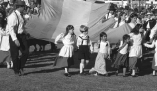
Como cada año, el campo y la ciudad se unen en el predio de la Av. Spinetto, un evento que atrae a todo el interior provincial y los estados vecinos.

Animales inscriptos A la fecha, se inscribieron 132 reproductores bovinos, destacándose la raza Angus como la de mayor concurrencia. También habrá Polled Hereford, mientras en porcinos, ovinos, equinos, aves, conejos y afines habrá casi 250 ejemplares registrados.