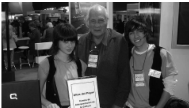
«Altos de Payún» y el Centro de Interpretación de la Cultura Ranquel.