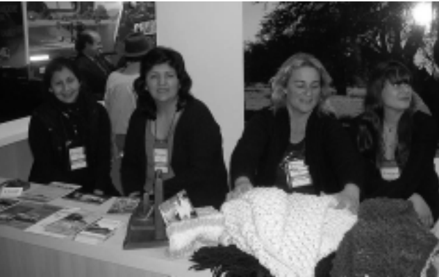
Dirección de Turismo Municipal de General Acha y prestadores de servicios.