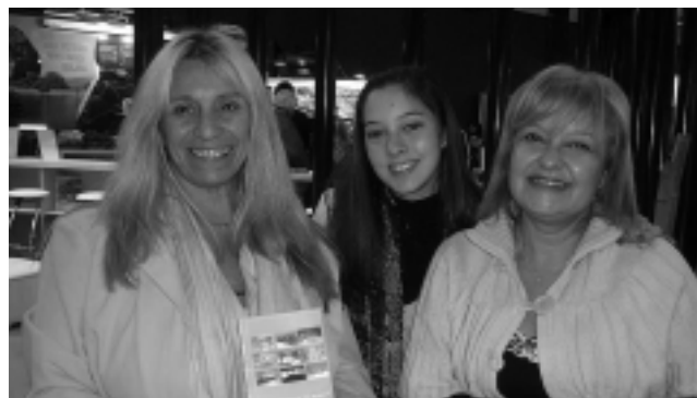
Turismo Municipal de Realicó y norte provincial.