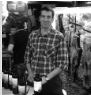
Bodega del Desierto.

En definitiva, el saldo de un trabajo mancomunado entre los prestadores del Turismo y la Subsecretaría, que se notó que era bueno.