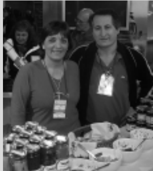
Productos Artesanales India.