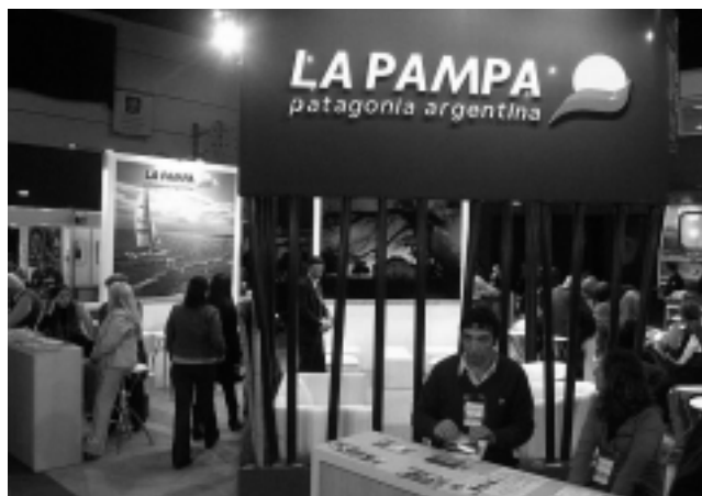
El stand pampeano, muy concurrido y visitado durante todo el fin de semana, con excelentes degustaciones de embutidos, vinos y dulces.