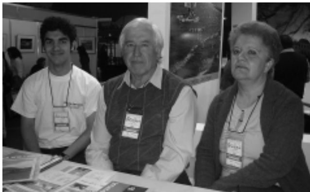
Turismo Municipal de Intendente Alvear y Eco Parque «Los Abuelos».