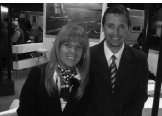
Zona Franca General Pico y Dirección Municipal de Turismo de Santa Rosa.