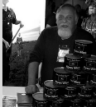
Dulces y Ahumados Kiyen Witru.