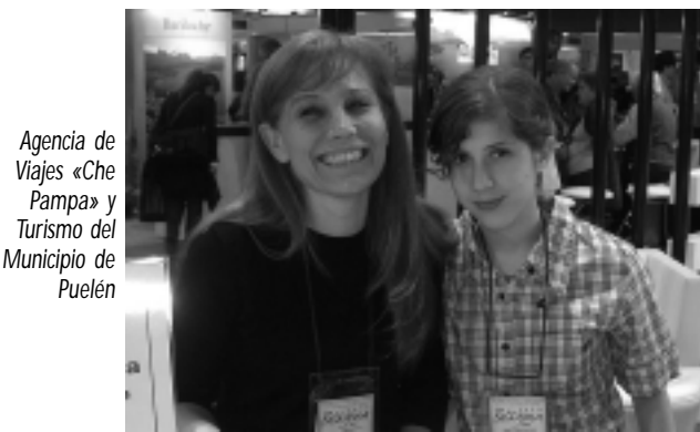
Agencia de Viajes «Che Pampa» y Turismo del Municipio de Puelén