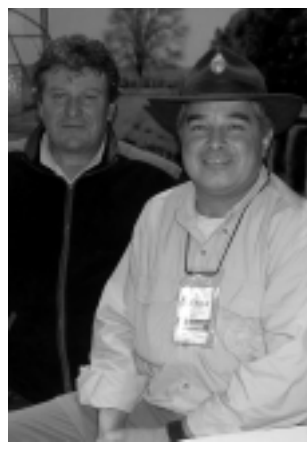
El titular de Cuchillos Artesanales «Pampita» junto al Intendente de Guardaparques del PN Lihué Calel.