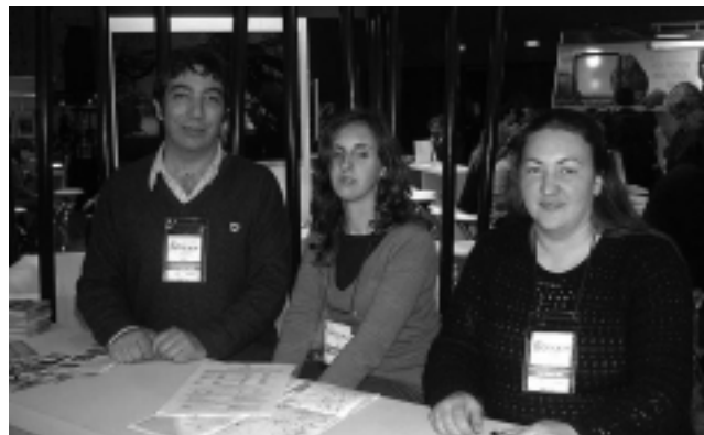
Turismo Municipal de Guatraché y de Jacinto Aráuz.