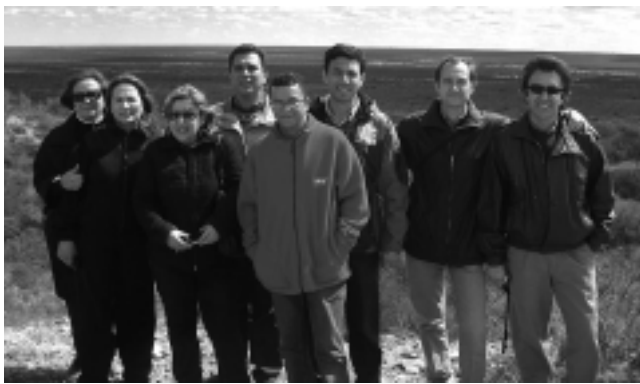
El grupo acompañante y los operadores en Quehué.