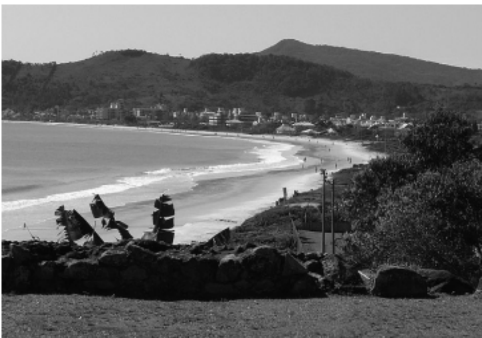
La playa brasileña Jureré Internacional, en el estado de Santa Catarina, es la primera de América Latina en recibir la certificación «Bandera Azul». Este sello, acredita la superación de unos estrictos controles de las playas, en la calidad de las aguas, información y educación ambiental, seguridad, servicios y gestión medioambiental.

Como ya habíamos anticipado en recientes ediciones (ver REGION N° 922 a 925), a pesar de la mala cotización que tiene para nosotros el real -moneda brasileña-, la poca