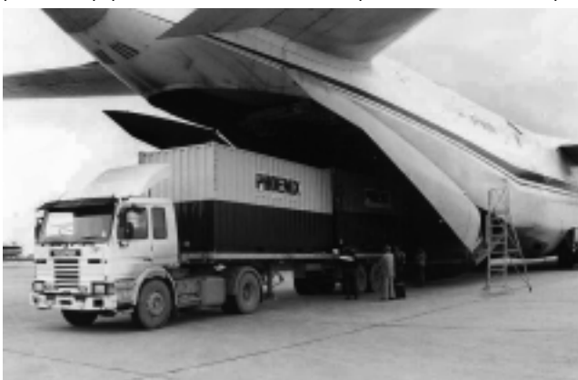
Los Volkswagen Race Touareg (favoritos de la carrera), no vienen por mar, sino por aire. Llegarán a la Argentina en un «Antonov», el gigantesco avión de carga de origen ruso, más grande y más pesado del mundo. En teoría -ya que en la práctica no sería posible-, la nave tiene la increíble capacidad de transportarse a sí mismo, es decir, llevar su mismo peso.

A la capital pampeana la carrera llegará el viernes 15 de enero, proveniente desde San Rafael, Mendoza, uno de los tramos más emocionantes. Esa noche harán campamento en el Parque Don Tomás de Santa Rosa y el sábado 16 emprenderán la última etapa.