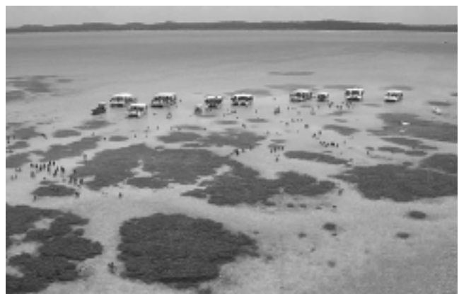
Las Piscinas Naturales de Maragogi, Brasil, conocidas como «Galés», se localizan en la hermosa Costa dos Corais, a escasos 6 kilómetros de la costa, y forman parte de la segunda mayor barrera de corales del mundo.