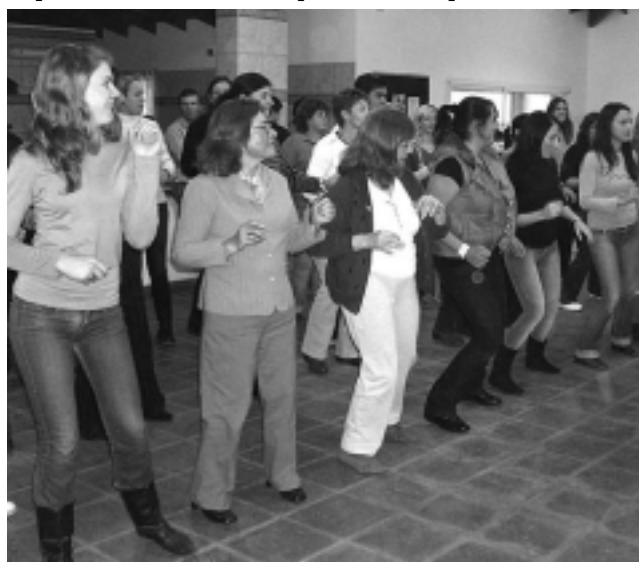
Cuando se proponen cosas divertidas para hacer en familia durante el tiempo libre, las personas pueden socializar, divertirse sanamente, ganar un premio, generando una experiencia que jamás olvidarán.

creación y Animación Turística, es un servicio que agrupa actividades socioculturales, deportivas, familiares, para adultos mayores, infantiles, para personas con atenciones especiales, etc. Les puedo asegurar que la no existencia de este servicio en muchos destinos, ha ocasionado que la afluencia de clientes a los establecimientos sea muy limitada. La gran mayoría de los atractivos que se visitan o disfrutan durante un viaje turístico, son actividades que se realizan por la mañana o cuando mucho, terminan en las primeras horas de la tarde. ¿Qué hacer en el resto del día?, ¿Y si llueve o el clima se presenta desfavorable?, estos son algunos de los mo-