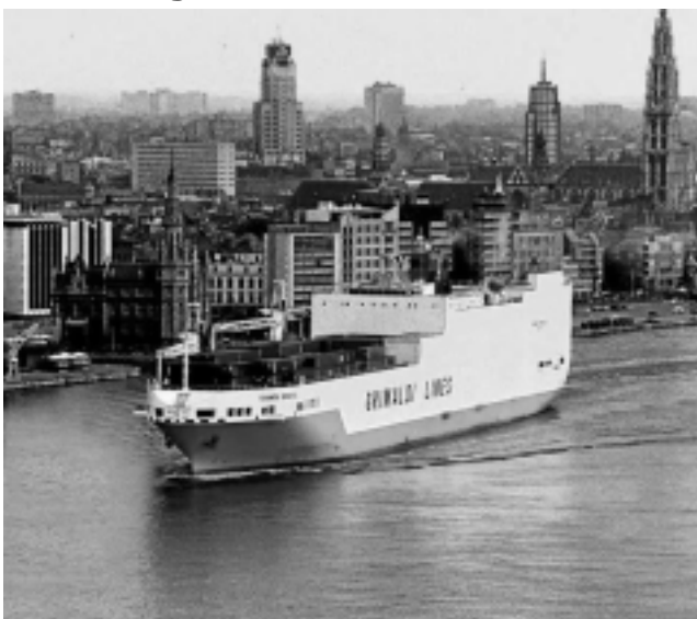
El carguero de «Grimaldi» tiene una capacidad de carga de 56.700 toneladas. Partió del puerto de «Le Havre» en Normandia, Francia y trae 550 vehículos europeos de competencia, organización y prensa.

El carguero «Grande Brasile» de la compañía italiana Grimaldi, ya viene atravesando el océano con 30 millones de dólares en sus bodegas. Son 550 vehículos del Dakar 2010. Ahí están la mayor parte de los coches, camiones y motos de los participantes europeos, más los de prensa, logística y la organización francesa, que se sumarán a los participantes americanos (casi 100, entre el norte y el sur del continente).