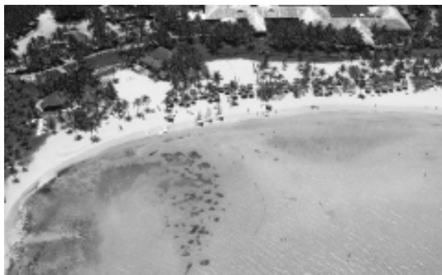
La zona del Mar Caribe conjuga aguas cálidas y transparentes, con arena finas y abundante vegetación, con hoteles de lujo y buena comida, con más...

Luego vienen destinos intermedios como Porto Seguro, Arraial D'Ajuda y otros, en el segmento de gasto entre u$s 1.200 y 1.400, también por semana, enero, base doble, en algunos casos hasta con media pensión. Y de aquí saltamos al segmento mayor del norte brasileño, por cierto el mejor, ya cercano a la línea del Ecuador, con servicios de alto nivel de «all inclusive» -todo incluido-, la receta jamaicana que rápidamente ganó popularidad mundial.