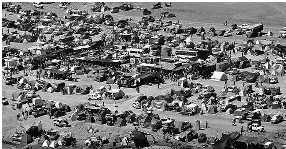
El sábado por la tarde hubo unas ocho mil personas en el hito del Cerro Campanario.

El pasado 5 y 6 de febrero, se realizó en el hito fronterizo del Paso Internacional El Pehuenche, el «51° Encuentro Binacional» en el límite de Argentina y Chile, al pie del Cerro Campanario.