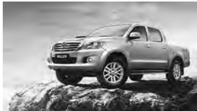
En un contexto en el que los patentamientos del mercado automotriz total cayeron un 28%, la automotriz japonesa fue la que más creció en 2014. Los modelos Hilux, Corolla y SW4 lideraron sus respectivos segmentos, mientras que en el top 20 de los modelos más vendidos de 2014, la pick-up Hilux se posicionó como el 2do vehículo más vendido entre todas las categorías, el compacto Etios se ubicó en la 10ma posición y el sedán Corolla en el puesto 16.

tica distintiva de Toyota, también registró récords de atención y satisfacción. En 2014, los 75 puntos de servicio oficiales de la red de Toyota atendieron a más de 400.000 unidades en todo el país, lo que representa un incremento interanual del 9,5%. Asimismo, el índice de satisfacción al cliente terminó el año en 85,5%, valor histórico de la marca en el país, mientras que el índice de intención de recompra se ubicó en 96%, el registro más alto de los últimos años. Con estos resultados, Toyota reafirma su compromiso con la industria nacional y continúa acercando productos y brindando servicios caracterizados por sus reconocidos valores de marca: Confiabilidad, Calidad y Durabilidad.