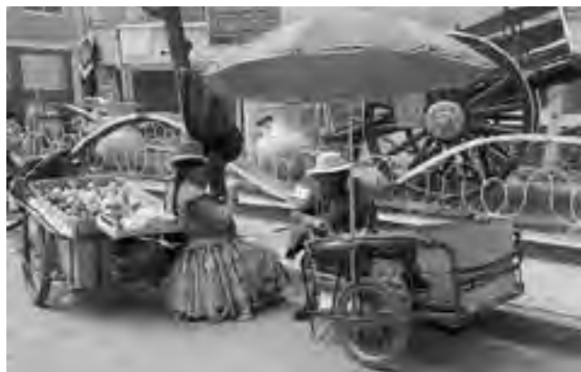
Villazón, Bolivia, un pueblo pintoresco donde se aprecian razgos culturales del vecino país, tanto en su vestimenta como en la gastronomía.

Cerca de La Quiaca hay un importante poblado, Yavi, que se destaca por su rico contenido histórico, ya que durante la guerra de la Independencia, la única vivienda en el lugar, perteneciente a un matrimonio declarado marqueses de Tojo, fue el fuerte de resistencia contra los realistas y actualmente es un museo que rememora la