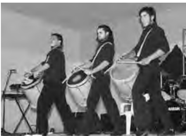
El grupo La Yesca Malambo y el conjunto Los Caldenes, estarán en el "1er Festival Nocturno de Jineteada y Folklore en Santa Isabel" el 28 de febrero.