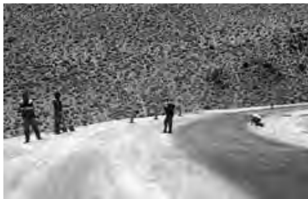
en enero de 2015 del lado argentino, donde aún faltan terminar 57 kilómetros, 35 siguen de tierra y 22 están en obras. Los políticos mendocinos quieren "apurar" la terminación ante de las elecciones, los técnicos enfrian los plazos con la realidad de la obra y dicen "quizá" en 2016.