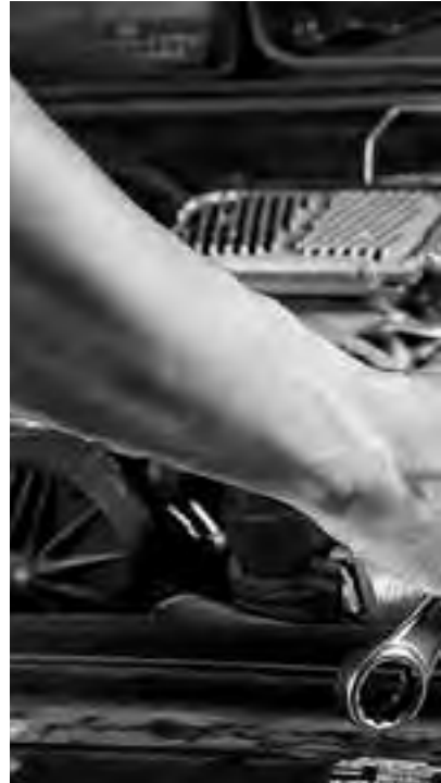
El 24 se recuerda el "Día del Mecánico", ese día nuestra unidad de traslado según sea su especialidad, un problema, pero al que pocas veces acudimos