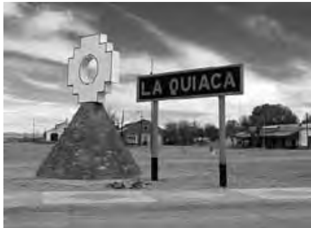
La Quiaca, ciudad fronteriza del extremo norte argentino en la puna de Jujuy, distante a 5.121 km de Ushuaia, la otra punta de Argentina hacia el sur.

Santa Catalina, con una antigüedad superior a los 300 años, posee una edificación muy pintoresca con calles empedradas, además de un legado cultural dejado por la cantora tucumana Mercedes Sosa,