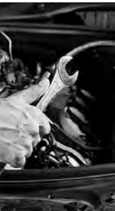
Trabajador que combina ciencia y arte para atender a la comunidad. A quien recurrimos con confianza a la hora de prevenir preventivamente. No se olvide de saludarlo...

La estabilidad con carácter de franco y pago, el 24 de Febrero como el Día del Trabajador Mecánico del Transporte Automotor. Para los trabajadores mecánicos, el 24 de febrero ingresó a través del tiempo en la vida del sindicato, como un día especialmente destinado al compromiso y el recuerdo.