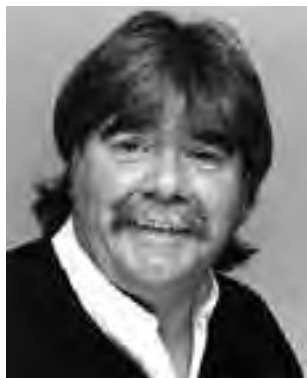
El Gato Peters estará este sábado 21 en General San Martín durante la "XII Fiesta Provincial de la Sal".

Mientras tanto en esta localidad pampeana, el sábado 21 y domingo 22 en la plaza San Martín, se llevará a cabo el Carnaval 2015. Habrá carrozas, comparsas, murgas, bandas locales y elección de la reina.