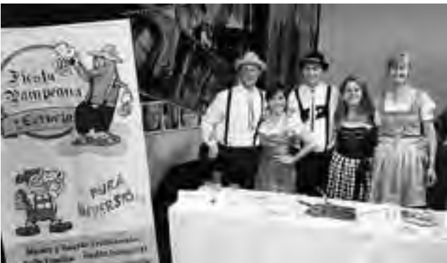
La semana pasada la Asociación Descendientes de Alemanes en La Pampa, promocionaron la fiesta en el marco del "Ciclo de Cine Alemán", llevado a cabo en la Sala Amadeus de Santa Rosa. Previo a la película "Amadas Hermanas", dirigida por Dominik Graf, hubo degustación de repostería y cerveza entre los asistentes.