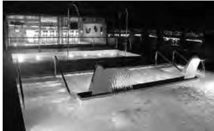
El sexto piso cuenta con un completo spa cubierto: sala de masajes, sauna, duchas de todos los estilos, vestuarios, sala de relax y gimnasio. El sector abierto de la terraza ofrece solarium y bar, en torno a dos piscinas. Una de ellas, amplia y moderna, posee dos "cascadas cortina" para relajación, e hidromasajes. Por uno de sus lados, el nivel constructivo dado la hace desbordante, provocando una fina y relajante cascada artificial a medida que filtra el agua, todo equilibradamente combinado con juego de luces rítmicas por la noche.