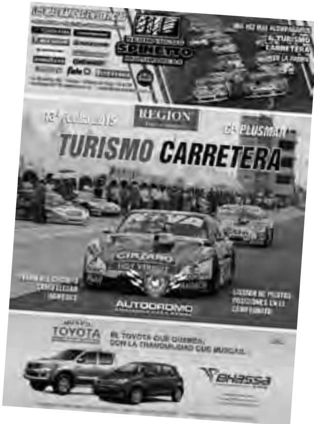
El suplemento color de REGION® con datos de la carrera se puede retirar hoy gratis de 9 a 18 hs. en nuestra redacción (uno por persona).