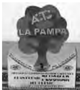
Trofeo del GP Plusmar del TC

Reservas en Terminal Santa Rosa, Of. 12 - Tel. (02954) 385100