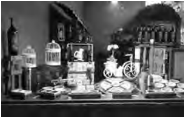
Cercana al centro de la ciudad, la nueva Tienda de Vinos "BocaNegra" es accesible y dispone de la comodidad que el cliente necesita para admirar sus vidrieras sin interrupciones, así como también para estacionar fácilmente y sin apuros.