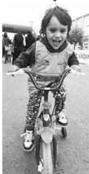
La categoría de 2 a 3 años, con gran entusiasmo, corrió en pata-pata, triciclo y bici.