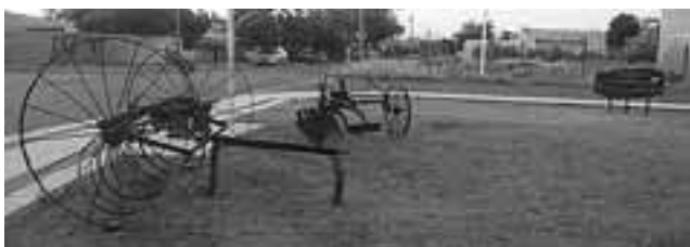
Plazoleta "Descendientes de Alemanes en La Pampa", en las calles Av. Luro, Juan XXIII y Varela en Santa Rosa.

Los alemanes del Volga (en alemán Wolgadeutsche) son alemanes étnicos que vivieron en las cercanías del Volga en Rusia, alrededor de Sarátov, desde el siglo XVIII.