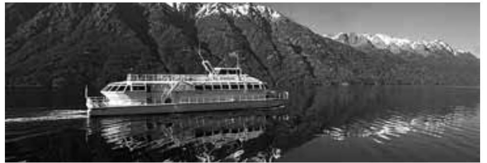
Sobran razones para agendar una escapada a Patagonia en Semana Santa.

En Puerto Madryn será protagonista el ya tradicional Vía Crucis Submarino -único en