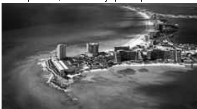
Cancún en México, también compite.

A todo esto, también se suman los viajes de egresados en Cruceros, a precios muy competitivos, donde nuevamente Brasil como destino ya picó en punta.