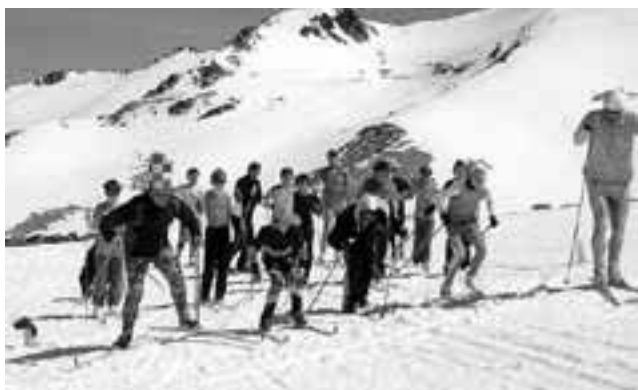
Viaje de Egresados ¿nieve, playa o cruceros?

Un relevamiento realizado por el diario sobre una decena de agencias de turismo estudiantil en Buenos Aires mostró que los paquetes de egresados a Bariloche se están ofreciendo a un promedio de 39.500 pesos, abonables hasta en 18 cuotas mensuales de alrededor de 2.200 pesos, aunque hay propuestas que llegan a 43.000 pesos. Son paquetes completos de una semana con pasajes, pensión completa, paseos, entrada a boliches, traslados y seguro médico. Los valores varían en función de las actividades elegidas, el medio de transporte (micro o avión) y especialmente dependiendo de la época.