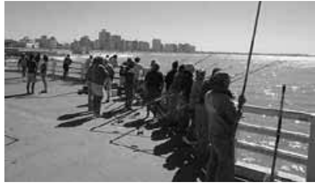
La pesca es una buena excusa todo el año.

La época es buena para hacer compras. Con la tem-