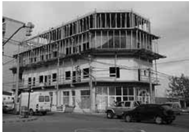
Tan acelerado es el crecimiento de la Ciudad, que hasta algunos inversores hacen pisos de más..., que luego tienen que demoler, como la obra que se levanta en la esquina de Av. San Martín Oeste y González.

Coincidiendo con la misma fecha, 22 de abril, en el aniversario fundacional de Santa Rosa, se celebra en todo el país el Día del Trabajador de la Construcción, oficio íntimamente ligado al crecimiento edilicio de la Ciudad, que por cierto, no ha sido poco.