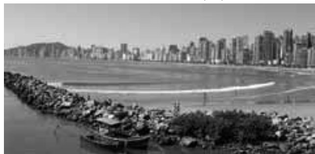
Camboriú, Brasil, el destino más accesible.