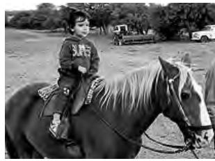
al 6.000. Centro ecuestre, cabalgatas, paseos en sulky. Eventos. Información (02954) 15644200.