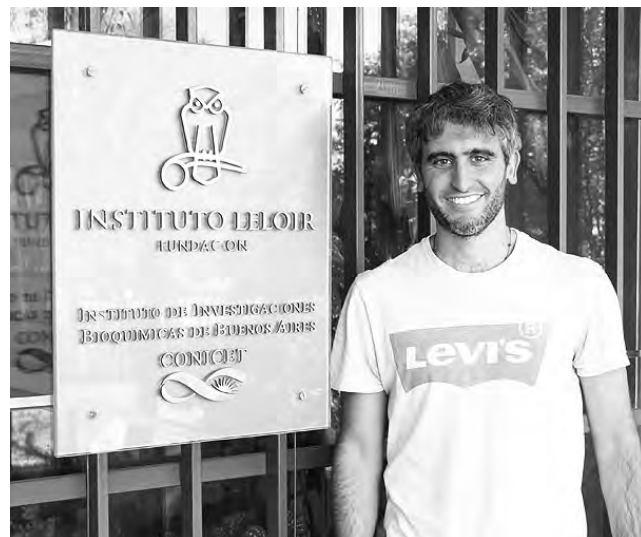
Foto: Silvio Temprana, ganador tesis de neurociencias.