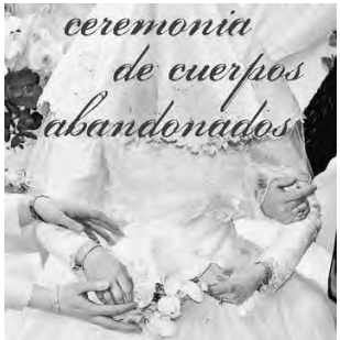
-Sáb. 21 y dom. 22 a las 21 hs: obra teatral "Ceremonia de cuerpos abandonados". A la gorra.

Quintana 172. -Vie. 20 a las 20 hs: Teatro Ciego "Un viaje a ciegas". $ 250. • Teatro ATP: Bolivia y J. Luro.