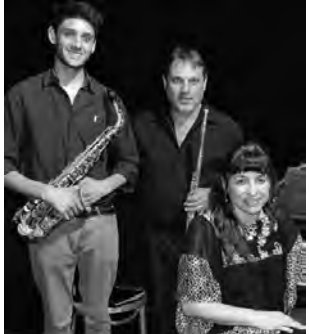
-Vie. 20 a las 21:15 hs: "Concertando Trío" música de cámara en dúos: piano- saxo; piano-flauta y tríos. $ 80.