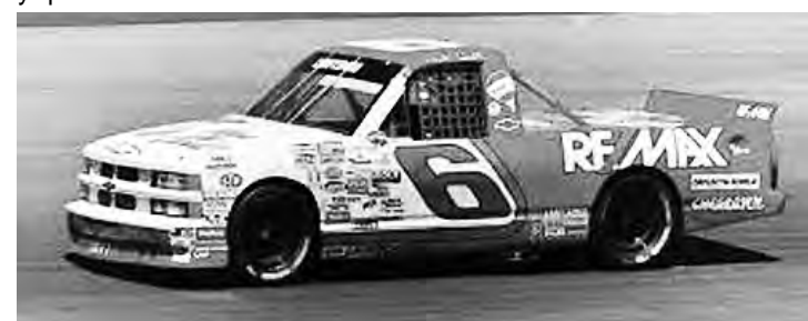
En Estados Unidos categorías similares son un gran éxito.