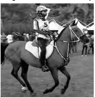
-Vie. 20: "Endurance ecuestre 40, 80 y 120 km".

• Jardín Botánico: Chimango casi Av. Perón. Sáb. dom. y fer.