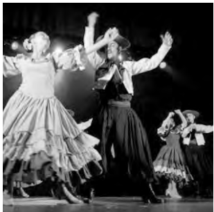
-Vie. 20 a las 21:30 hs: folklore en la Peña La Viajera.