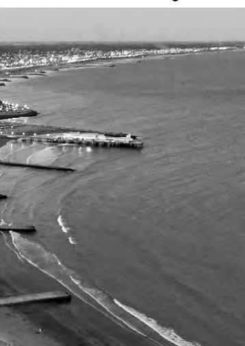
disfrutar todo el año.

Esta ciudad de la provincia de Mendoza es el hogar de un