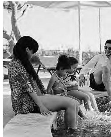
Termas de Río Hondo, la c

A 70 kilómetros de Santiago del Estero se encuentra Termas de Río Hondo, una ciudad al lado del río Dulce con un atractivo realmente especial: sus aguas termales. Te recomendamos aprovechar los precios para esta época del año para que te relajés unos días en sus aguas y quedés completamente renovado. Precios en comparación al mes pasado -16.6% Precio promedio $2.878