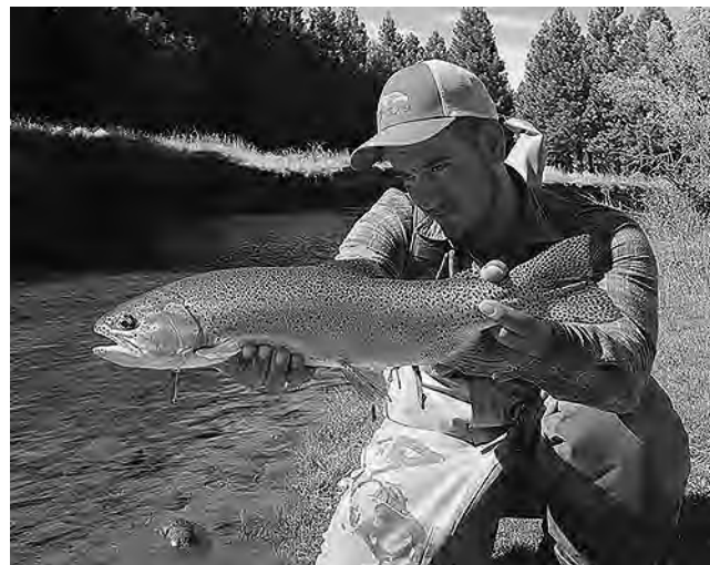
de pejerrey patagónico.

La localidad pampeana de Speluzzi, fue fundada el 11 de noviembre de 1907, por Balvini y Cia, firma vinculada a la empresa de Tomás Devoto. Como varias localidades de la zona, se formó bajo el influjo de la llegada del ramal ferroviario Catrilo - General Pico - Realicó, que también, en esa línea, apuntaló más al sur la formación de Relmo, Miguel Cané y