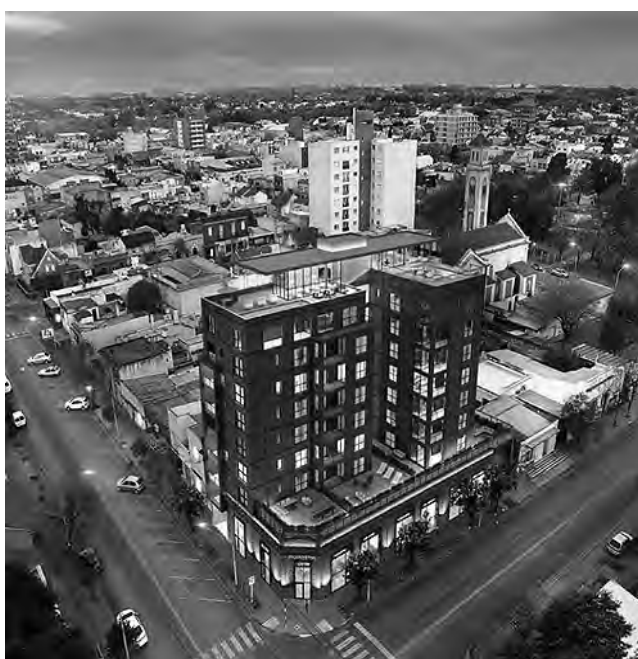
Así quedará terminado el "Edificio Pérez", actualmente en construcción en la esquina de calles 9 y 20.

General Pico se destaca con obras para imitar, como la del salón La Fontana (REGION ®