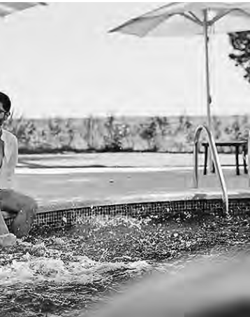
ciudad al lado del río Dulce.

la Casa Natal de Sarmiento y el imperdible Museo Provincial de Bellas Artes.