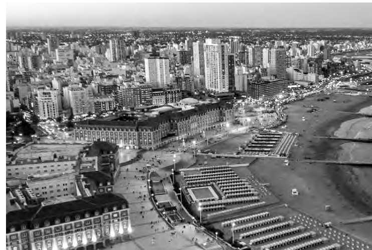
Mar del Plata, destino favorito de los argentinos para a

Otra ciudad muy famosa por su cultura vitivinícola y desde donde se pueden realizar muchas excursiones ideales para los amantes de los paisajes y la naturaleza característica de los Andes. Una ciudad que ofrece una experiencia muy cultural, desde