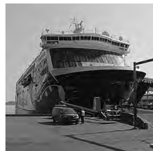
El puerto de Tallin es el de mayor tránsito de ferrys hacia Helsinki y Estocolmo.

La joya de Tallin, capital de Estonia y cien por ciento báltica, es su casco histórico (Vanalinn) -también declarado Patrimonio de la Humanidad por UNESCO-, donde se conserva la Antigua Ciudad Amurallada. Un recorrido de calles sinuosas que datan de los Siglos XIV y XV, barrio considerado uno de los recintos medievales con más