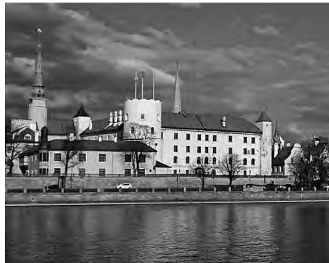
Riga, la capital de Letonia, es una ciudad maravillosa, que se destaca por su gran belleza y su exquisita arquitectura, donde el 'art nouveau' conquista todo.

En ediciones anteriores (ver REGION® Nº 1.357 y 1.358) publicamos la parte 1 y 2 de una serie de notas sobre "Un recorrido junto al Mar Báltico", correspondiendo la primera entrega a la etapa "Planificación" y la segunda