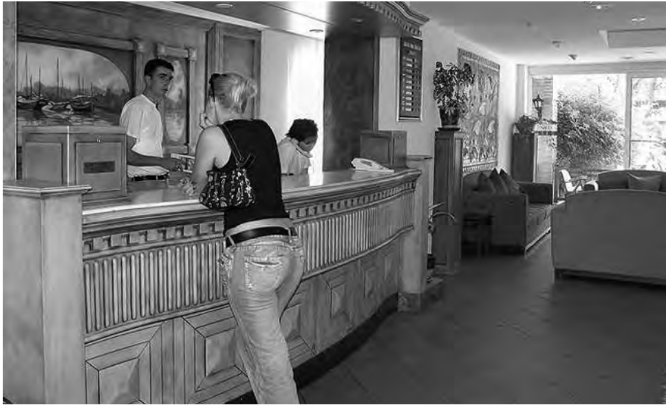
78% de los argentinos encuestados planean hospedarse durante 2019 en un alojamiento que le permita interactuar con su anfitrión.

Más de la mitad de los argentinos deciden volver a un mismo hospedaje gracias a su anfitrión y el 61% busca "sentirse como en casa" cuando llega a su alojamiento. La comunidad viajera hoy en día cuenta con más variedad que nunca a la hora de planificar un viaje, tener éxito como "anfitrión" puede ser la diferencia entre que los huéspedes elijan un alojamiento u otro. De hecho, a partir de una investigación de Booking.com en la que participaron más de 500 argentinos (21.500 personas a nivel global) se descubrió que un 72% de los argentinos cree que su estadía fue mejor gracias a que la persona que administraba el alojamiento hizo todo lo posible y más para brindar la mejor experiencia. Por eso