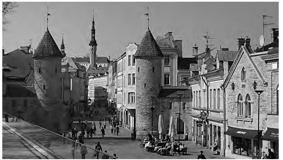
La joya de Tallin, capital de Estonia, es su casco histórico donde se conserva la Antigua Ciudad Amurallada. Un recorrido de calles sinuosas que datan de los Siglos XIV y XV, barrio considerado uno de los recintos medievales con más encanto de Europa.

Lo imperdible estando de visita en Riga, es navegar el canal acuático interno que atraviesa la ciudad y que obviamente, se conecta con