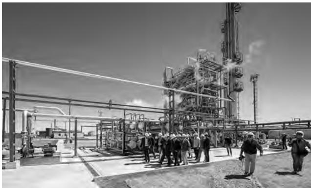
La Pampa tiene de todo, se destacan la sal, yeso, bentonita, rocas de aplicación, etc., aunque hoy lo más preciado resultan los hidrocarburos como gas y petróleo.

El 7 de mayo, fecha en la que se recuerda el "Día de la Minería", fue implementado en conmemoración a la sanción de la primera Ley de Fomento Minero por la Asamblea Constituyente a propuesta de la Junta de Gobierno, el 7 de mayo de 1813.