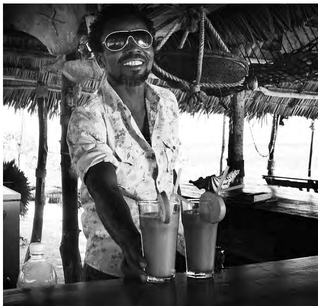
La investigación también demostró que, si bien parte de la comunidad viajera estaría satisfecha con una bienvenida cálida y simple, otras personas tienen expectativas altas y esperan más de sus anfitriones cuando viajan.

Entre los beneficios de los alojamientos con anfitriones se encuentran: que para la mayoría, el principal punto a favor es sentirse "como en casa" (el 61% de los argentinos indicó que esto le parecía importante), mientras que, por otro lado, para el 64%, es una oportunidad para tener información que solo puede tener un local. Este factor fue considerado por el 45% de la comunidad viajera de todo el mundo, y el 50% en Argentina, expre-