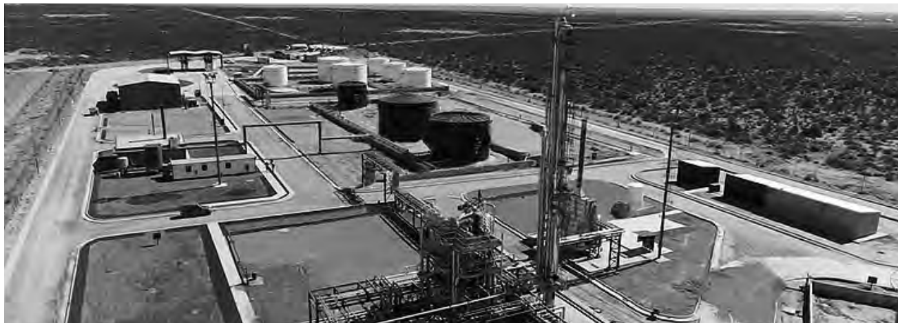
Planta de Procesamiento "RefiPampa", la primer refinería de petróleo pampeana instalada en la localidad de 25 de Mayo, a su vez la primer PyME con oleoducto propio en Argentina.