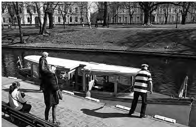
Lo imperdible en Riga es navegar el canal que atraviesa la ciudad con un recorrido espectacular desde el agua.