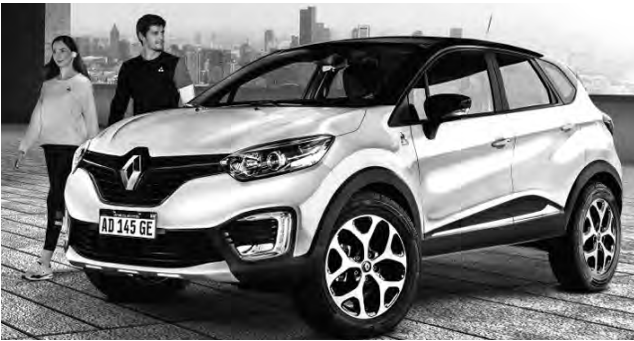
VIENE DE TAPA

Detalles únicos La combinación exclusiva en su exterior con su carrocería bitono blanco glaciar y techo negro nacré con el interior y tapizados en dos tonos resaltan más aún el diseño de esta serie limitada haciéndola única en la gama.