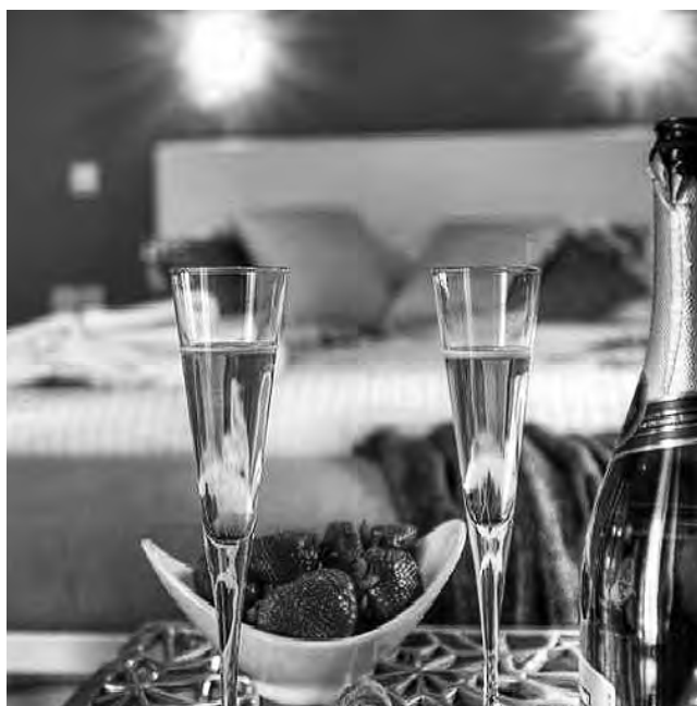
72% de los argentinos cree que su estadía fue mejor gracias a la persona que administraba el alojamiento. Porque les permitió sentirse como en casa, tener información como un local y ahorrar dinero durante sus vacaciones.

miento para muchos le suma un elemento social al viaje, lo que queda demostrado por el 49% de los argentinos que respondió que le gustaría expandir su círculo social y que la persona que administra su alojamiento los invite a una fiesta.