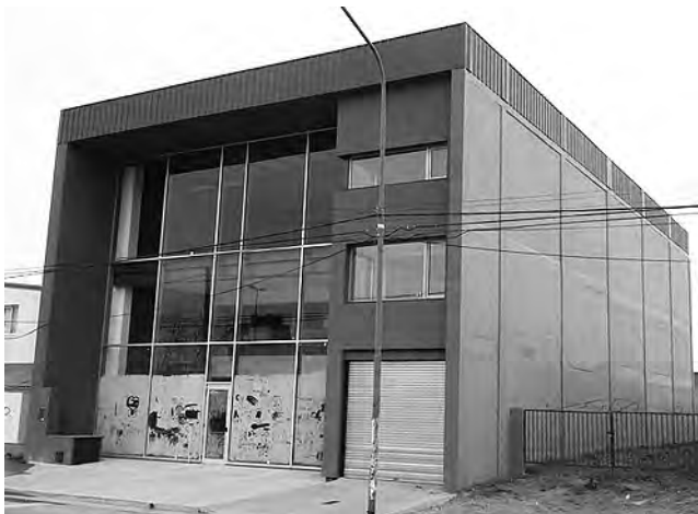
Nueva sucursal de "Pastorutti..." en Av. Circunvalación Sur entre Brasil y Autonomista, próxima a inaugurarse.

La empresa pampeana "Pastorutti Materiales Eléctricos" nació en 1981, siendo desde entonces una empresa líder en La Pampa.