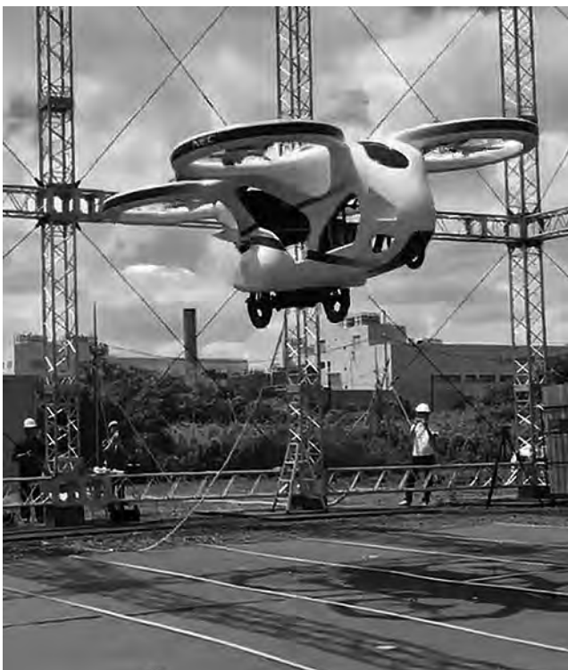
El vehículo, que a simple vista se asemeja a un dron, logró mantenerse en vuelo aproximadamente durante un minuto, informó The Japan Times.

La compañía japonesa NEC Corp. hizo recientemente una presentación pública de su nuevo auto volador ante medios de comunicación en las afueras de Tokio (Japón). El vehículo, que a simple vista se asemeja a un dron, logró mantenerse en vuelo aproximadamente durante un minuto, informó The Japan Times. Durante la prueba, el vehículo, que se espera pueda transportar personas, pudo elevarse brevemente a unos tres metros del suelo. Alimentado por una batería, el modelo mide 3,9 metros de largo por 1,3 metros de ancho y pesa 148 kilos.