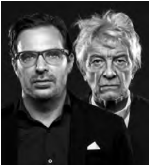
21:30 hs: Teatro "Un Instante sin Dios". $ 500 $ 400 y $ 350.