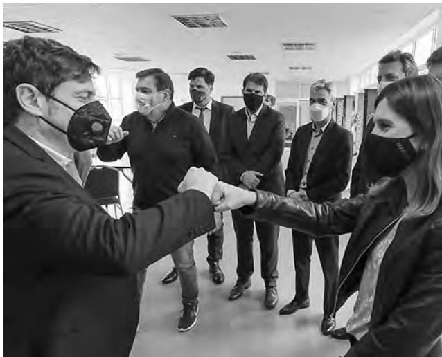
Saludo entre el gobernador de la provincia de Buenos Aires, Axel Kiciloff y la directora ejecutiva de la ANSES, Fernanda Raverta. Fue en Mar del Plata, en el anuncio de la obra de dragado del Puerto.

En el marco del anuncio de la obra de dragado del Puerto de Mar del Plata, la directora ejecutiva de la ANSES, Fernanda Raverta, se refirió a la nueva fórmula de movilidad de los haberes jubilatorios que impulsa el Gobierno de la Nación y que buscará aprobar en el Congreso: "Tenemos muchas expectativas en este nuevo cálculo para que contenga lo más importante: un haber digno para cada jubilado, pero también una fórmula sustentable para que el organismo pueda seguir asistiendo a los futuros jubilados".