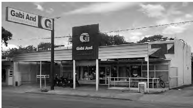
VIENE DE TAPA

Más tarde se trasladaron a Tomás Mason 1.163, dirección actual, con el autoservicio que años después se transformó en supermercado. «La gente siempre nos respondió muy bien y gracias al apoyo incondicional de ellos, al aporte de nuestros empleados y la buena relación con los proveedores, nos hemos afianzado brindando siempre un buen servicio, manteniendo calidad y precio, y sobre todo preservando esa familiaridad entre cliente y propietario, haciéndolo sentir como uno más de nosotros; ésta es la política adoptada desde nuestro inicio y la cual ya es un nuestro lema» afirmaron desde «Gabi And».