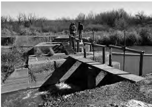
El aprovechamiento del agua en La Pampa tiene su principal exponente en el trabajo del Área Bajo Riego tutelada por el Ente Provincial del Río Colorado.

El Día Mundial del Agua se celebra el 22 de marzo de cada año y su principal objetivo, es crear conciencia en el hombre de la importancia de cuidar el llamado oro líquido para la vida de los seres humanos y las especies en la Tierra. Asimismo, con el objetivo de estimular en todos los argentinos la conciencia en el uso de los recursos hídricos, se estableció que el 31 de marzo se celebre el Día Nacional del Agua, por Resolución Ministerial N° 1630 del año 1970.