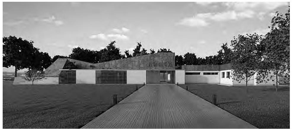
Durante marzo quedará inaugurado el nuevo Auditorio Municipal con comodidades ideales para reuniones amplias, con una capacidad para más de 100 personas.

Como estamos con las restricciones por la pandemia -dijo- no vamos a llevar a cabo actividades masivas como las que veníamos haciendo otros años, pero si estamos programando otras formas de conmemorar ese día porque creemos que la Reafirmación de los Dere-