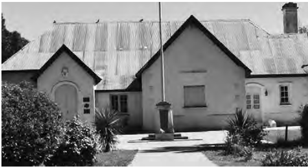
El frente de la Escuela aún conserva la estructura edilicia original de un siglo atrás.