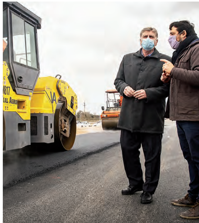
La pavimentación de la RP N° 4 ya es una realidad que lleva ejecutada un avance del 30 %. Es una obra vial muy esperada que arranca en la RN N° 35 y va hasta la intersección con el acceso a Caleufú, pasando frente a la entrada de Arata. El pasado viernes fue recorrida por el gobernador Ziliotto y el presidente de la DPV, Cadenas.

La localidad pampeana de Arata, arriba el próximo 1 de julio a los 110 años de su fecha fundacional. Su actual intendente, Jorge Sosa, le ha dado una impronta de progreso a su pueblo, siendo uno de los últimos logros la concreción de una nueva estación de servicios y la satisfacción del resultado de tantas gestiones para lograr la pavimentación de la RP N° 4 que pasa frente a la localidad.