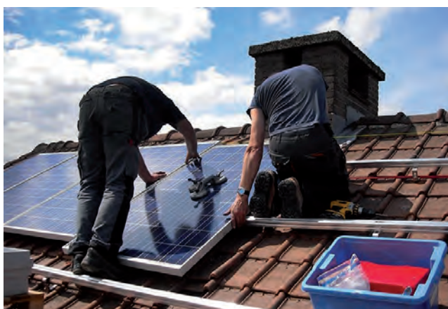
Los equipos de generación fotovoltaica, a partir de la luz solar, son los más fáciles de gestionar para los usuarios y también los más baratos, dependiendo su volumen.

Desde mediados de junio se puso en marcha el Régimen de Generación Distribuida, de manera que los pampeanos ya pueden convertirse en Usuarios Generadores.