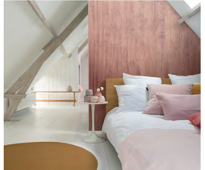
La premisa: la calidez. La respuesta: el noble material. Provocar sensaciones positivas que conviertan la casa en hogar, en refugio de protección.

Presente en todas las tendencias, la madera nunca pasa de moda. En mayor o menor medida el material aparece en cada estilo decorativo, en cada ambiente, en cada rincón. Si nos preguntáramos cuánta hay en nuestra vida, la respuesta probablemente nos sorprendería. Con la revalorización del hogar, avanzó, conquistando más y más metros cuadrados.