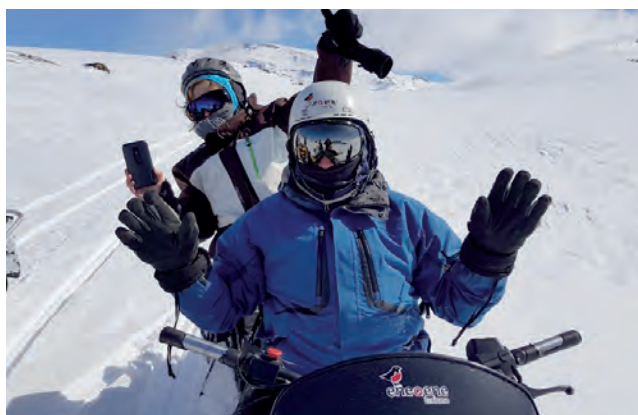
Los recorridos en motos de nieve son una simulación casi perfecta de una experiencia tipo antártica, para llegar al Volcán Copahue, límite natural entre Argentina y Chile.

Sonreír. Disfrutar. Sentir. Conocer... Cuatro sensaciones que Caviahue, en la provincia del Neuquén invita a vivir.