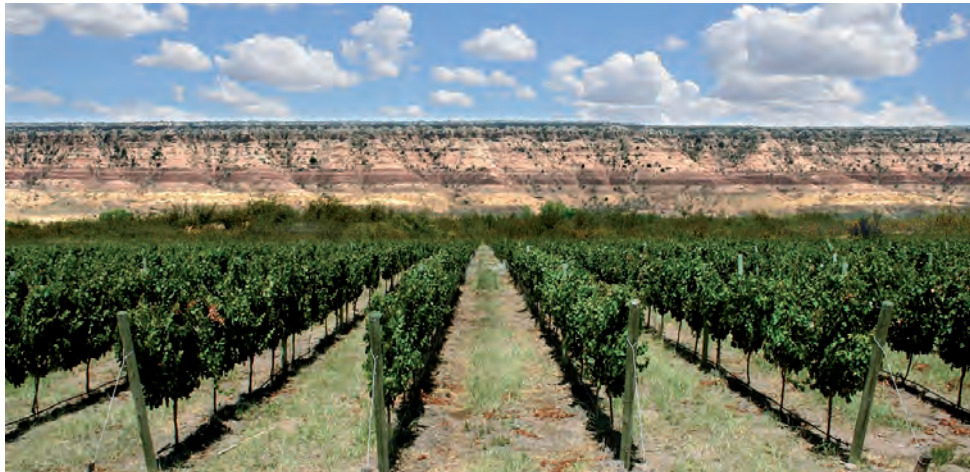
El 28 de junio el Ente Provincial del Río Colorado (EPRC) cumple 59 años desde su creación en 1962, período durante el cual logró modificar la fisonomía del desierto pampeano mediante un buen aprovechamiento del recurso hídrico que lo originó.

Funcionó con esa denominación hasta el año 1966. Por Decreto Acuerdo 775/66 se intervino el Organismo y por Ley 441 del mismo año se lo denominó Secretaría de Planificación y Desarrollo de la Cuenca del Río Colorado, hasta que el 25 de septiem-