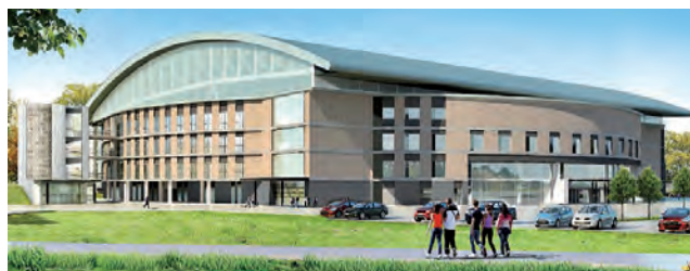
Así debería quedar -14 años después-, la obra del Megaestadio de Santa Rosa con el nuevo techo parabólico.

La empresa que ganó la licitación tiene un plazo de 120 días a partir de la firma del contrato para realizar el desguace y retiro de las estructuras, tarea que será supervisada por la Dirección de Inspecciones de la Provincia.